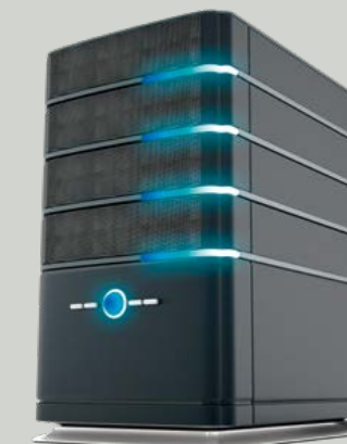
Server firmenintern oder in der Cloud

Datenübertragung über • LAN • WLAN Access Point • GPRS