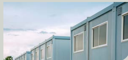
Temporäre Bürocontainer für Drittunternehmen