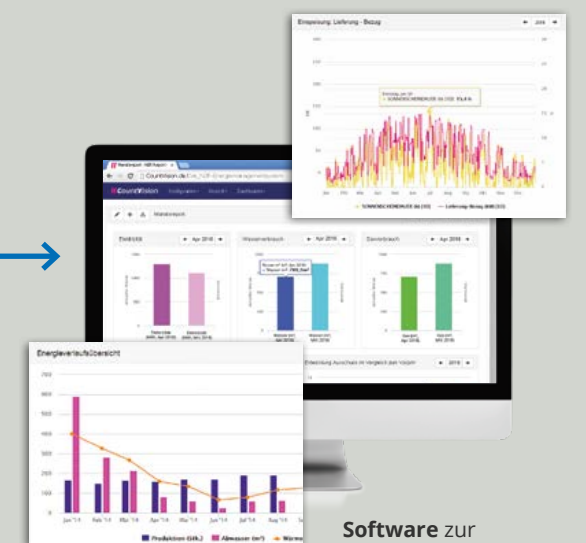
Software zur kundenspezifischen Visualisierung und Verarbeitung