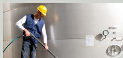
Subunternehmen mit eigenem Elektrowerkzeug