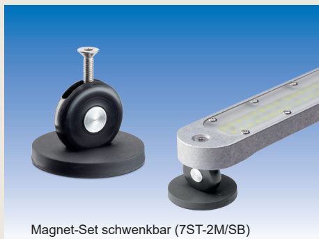
Magnet-Set schwenkbar (7ST-2M/SB)