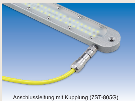
Anschlussleitung mit Kupplung (7ST-805G)